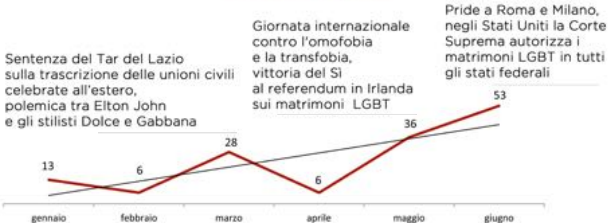
Numero di notizie LGBT per mese

142 notizie trasmesse nel corso di 6 mesi , con un trend in crescita costante.